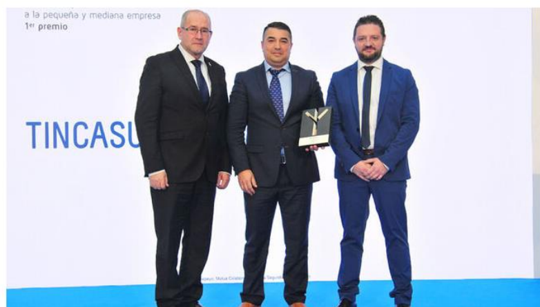
La dirección de Tincasur recogió el premio a la pequeña y mediana empresa