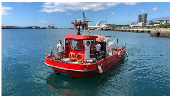
Un barco con la tecnología Ocean Cleaner en Tenerife.

• Los buques cuentan con una tecnología desarrollada específicamente para la recogida de residuos